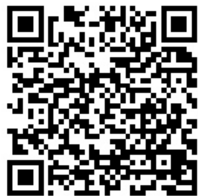
Bahar Batik 3675

300 g Bahar Batik 3675 200g Bahar Liso 128 1 Gancho #4 1 Tijeras 1 Aguja estambrera Alfileres